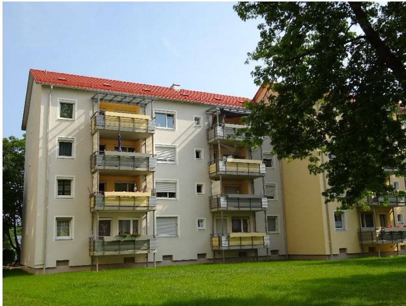
Adresse: Obermayerstraße 6-8, 87600 Kaufbeuren

Moderne Wohlfühlwohnung in zentraler Lage!