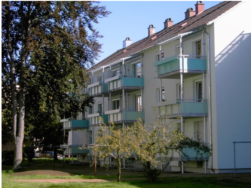
Adresse: Wagenseilstraße 1-9, 87600 Kaufbeuren

Moderne Wohlfühlwohnung in zentraler Lage!